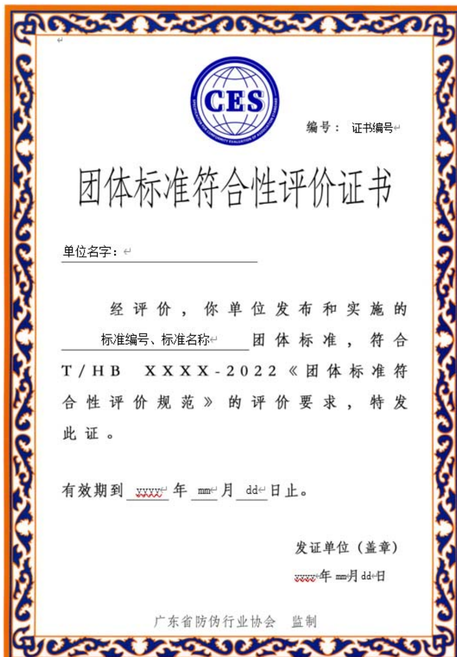
图 D.1 团体标准符合性评价证书