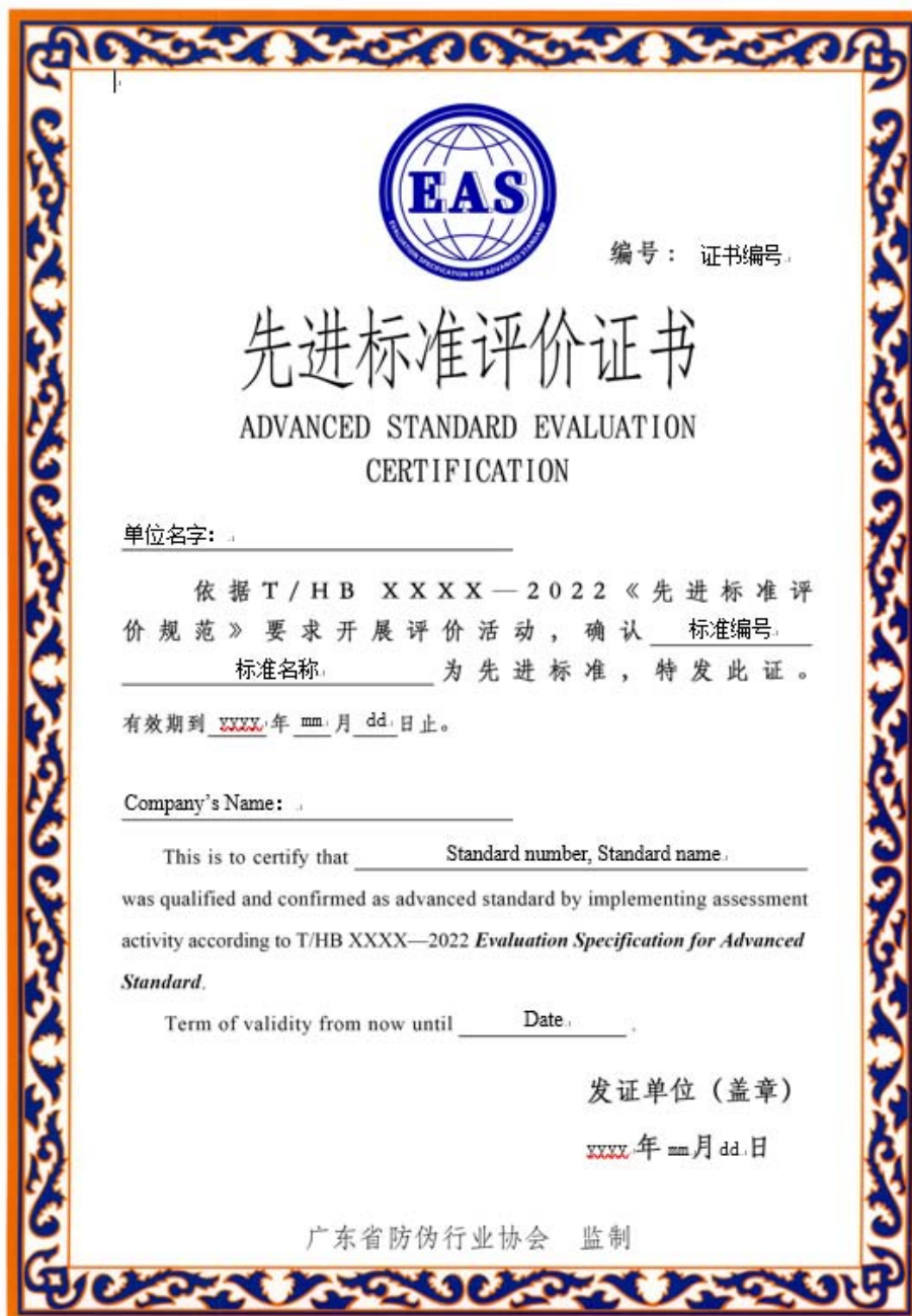
图 D.1 先进标准评价证书